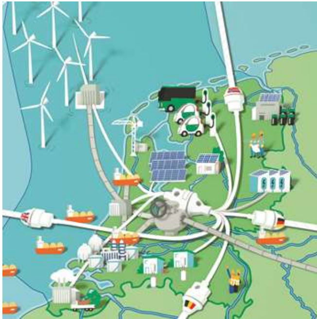
Illustratie: Accelerating the energy transition, McKinsey 2016