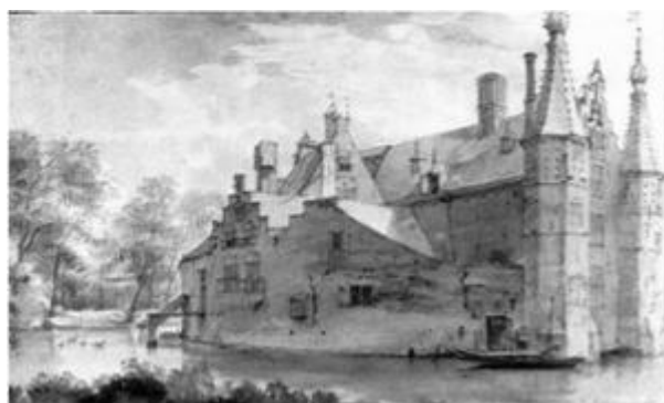
Huis ter Does