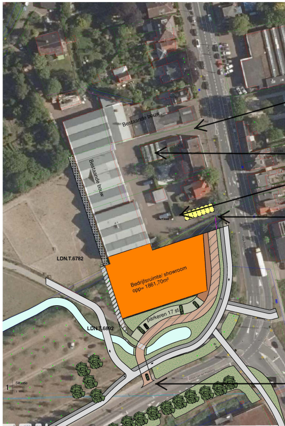
Situatie bedrijfsgebouw en parkeren